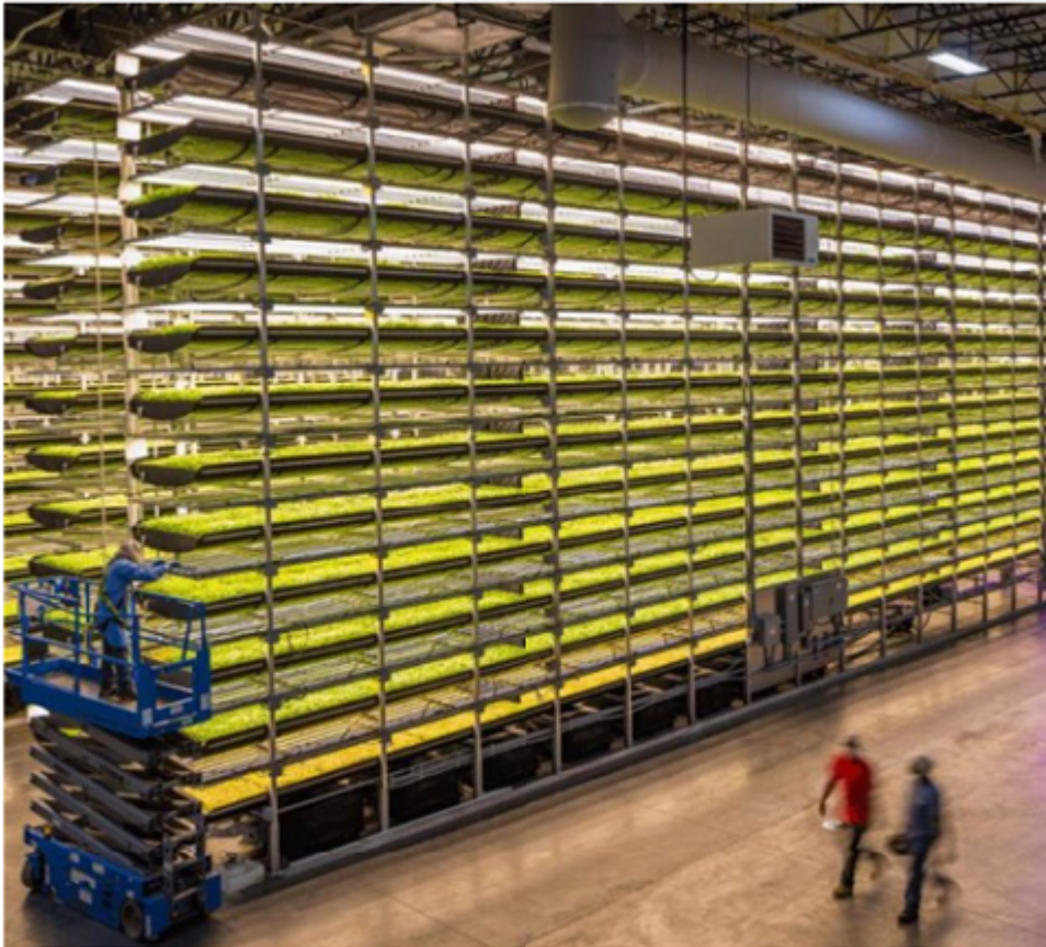
La compañía americana AeroFarms es una de las grandes referentes en agricultura vertical.

El potencial de la agricultura vertical está bajo la lupa de los inversores. Son proyectos de triple impacto: social, económico y ambiental, y además se enfocan en una problemática crucial: la provisión de alimentos. Plenty, la compañía con sede en San Francisco, está detrás de este concepto. La firma cuenta con el patrocinio de Amazon y el gigante japonés en tecnología, SoftBank, entre otros grandes inversores: Finistere Ventures, DCM Ventures, Eric Emerson Schmidt (ex director ejecutivo de Google y actual presidente de Alphabet) y Louis Bacon. Una granja de Plenty está diseñada para ser de 1,2 a 4 hectáreas, donde las plantas crecen lateralmente en columnas verticales de entre 7 y 20 pies de altura y puede producir entre 150 y 350 veces la producción de una huerta de campo. China es el blanco de este proyecto ya que posee menos de un tercio de la tierra cultivable por persona en comparación con Estados Unidos. Se espera que China sea la sede de al menos 300 de las fincas de Plenty. El desafío de diseñar granjas verticales altamente eficientes atrajo a Tesla (compañía de vehículos liderada por Elon Musk). Luego de 12 años de antigüedad en la famosa empresa automotriz, el ingeniero Nick Kalayjian se suma a eficientizar la agricultura.