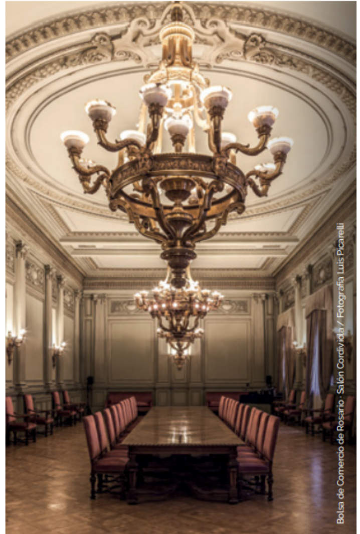
Bolsa de Comercio de Rosario - Salón Comidilla