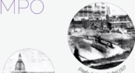
Estado de Obra, 28 abril 1927

El edificio fue el último en completar la mítica esquina de Córdoba y Corrientes: La Agrícola 1907 | La Inmobiliaria 1916 | Palace Hotel 1920.