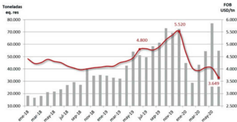
Gráfico: Volumen mensual exportado a China y Precio FOB promedio de la tonelada embarcada.

Afortunadamente, Europa está recuperándose muy sostenidamente. Esto se ve no sólo en volumen sino también en los valores pagados. El inicio del nuevo ciclo Hilton 2020/21 ya refleja esta recuperación acompañando una cautelosa flexibilización de las restricciones impuestas por los países europeos a causa de la pandemia. El volumen total exportado a este destino -incluido lo remitido bajo el contingente Hilton y 481- alcanzó las 3.550 toneladas peso producto de carnes enfriadas, unas 5.300 toneladas en su equivalente de res con hueso, 21% más que lo embarcado en mayo. Esta cifra marca por segundo mes consecutivo una recuperación de los volúmenes desde el piso de 1.700 toneladas equivalentes registrado en abril pasado, en plena paralización a causa del Covid. A su vez, el valor promedio de la tonelada exportada aumentó un 8,5% en el último mes, superando nuevamente los USD 8.000 la tonelada. Si nos ajustamos exclusivamente en las partidas Hilton, en las últimas semanas hemos visto alzas de hasta USD 2.000 la tonelada, pasado de valores de 11.000 a 11.500 dólares e fin de junio a 13.000 a 13.500 dólares actuales para cortes como el Ral o el Bife Ancho Hilton.