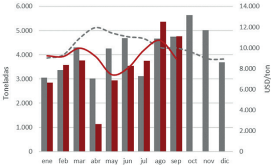
Imagen 2: Volumen y precios promedio de exportación con destino a Unión Europea. (Datos INDEC)

Mercado exportador: recrudece el covid en Europa y se posterga la recuperación - 06 de Noviembre de 2020