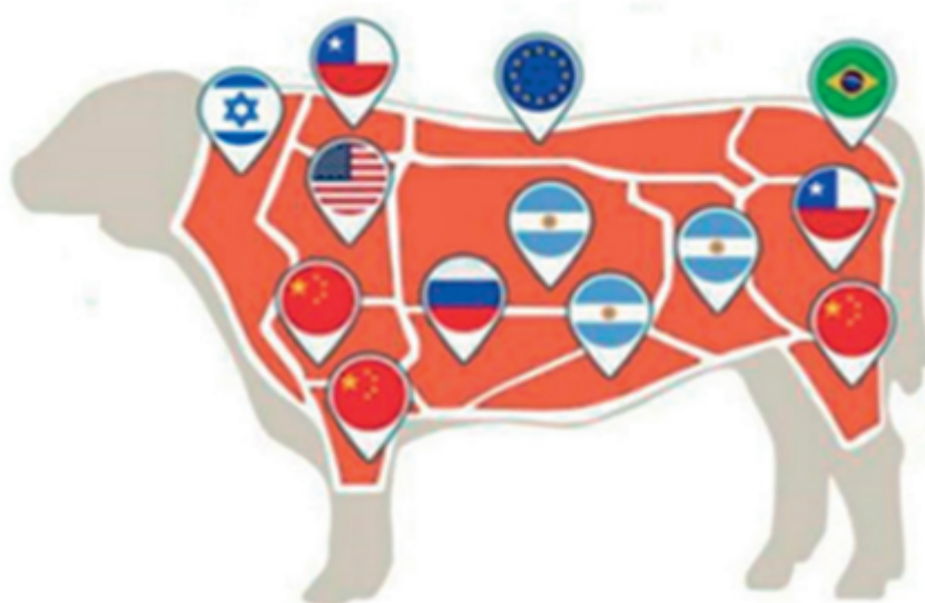
Mapa de cortes exportados a los distintos destinos.

Una representación muy gráfica presentada en el Outlook ganadero del movimiento CREA en 2019 permite comprender muy claramente esta complementariedad de mercados con la que cuenta Argentina.