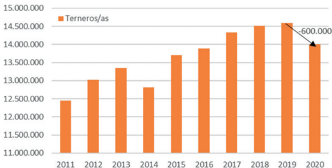
Gráfico 1: Terneros/as registrados en la segunda campaña de vacunación de Antiaftosa.

En el caso de novillos y novillitos, ambas categorías de machos, en conjunto, registran un retroceso de aproximadamente 190.000 cabezas de una vacunación a la otra. Sin embargo, mientras que para los novillitos (5.314.702 cabezas) la baja del último año representa una caída de unos 88.000 animales -siendo la primera de los últimos 5 años-, en el caso de los novillos la caída del último ciclo alcanzaría a unos 104.000 animales, pero es la 16ta. caída anual consecutiva que acumula un faltante de más de 3,7 millones de cabezas, al pasar de 6.359.587 cabezas en 2004 a los 2.638.124 actuales, esto siempre basándonos en los datos de vacunación de la segunda campaña de cada año.