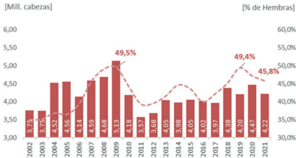
Imagen 1: Faena vacuna del primer cuatrimestre. Cifras expresadas en millones de cabezas

Faena Bovina: Radiografía parcial y desfasada de las decisiones del productor - 14 de Mayo de 2021