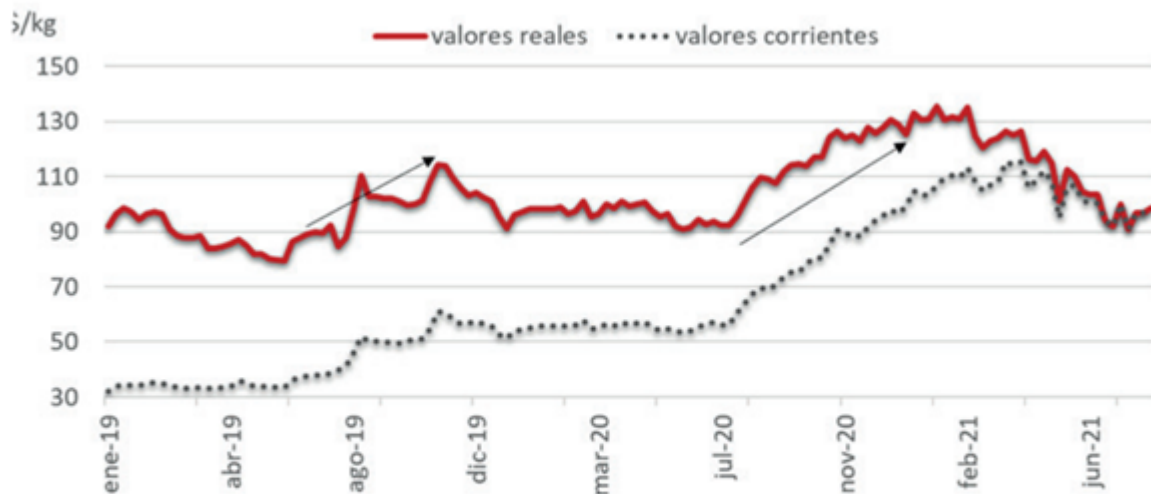
Precios de la vaca conserva en el Mercado de Liniers, promedios semanales en pesos (valores corrientes y deflactados)

Por otra parte, es importante tener en cuenta que ya estamos ingresando al trimestre donde China acelera sus compras y comienza a presionar fuerte sobre los valores. Si observamos en el gráfico siguiente la línea de precios a valores reales (deflactados), vemos que a partir de septiembre y hasta noviembre e incluso principios de diciembre, los precios tienden a apreciarse, para luego caer con el retiro de China del mercado.