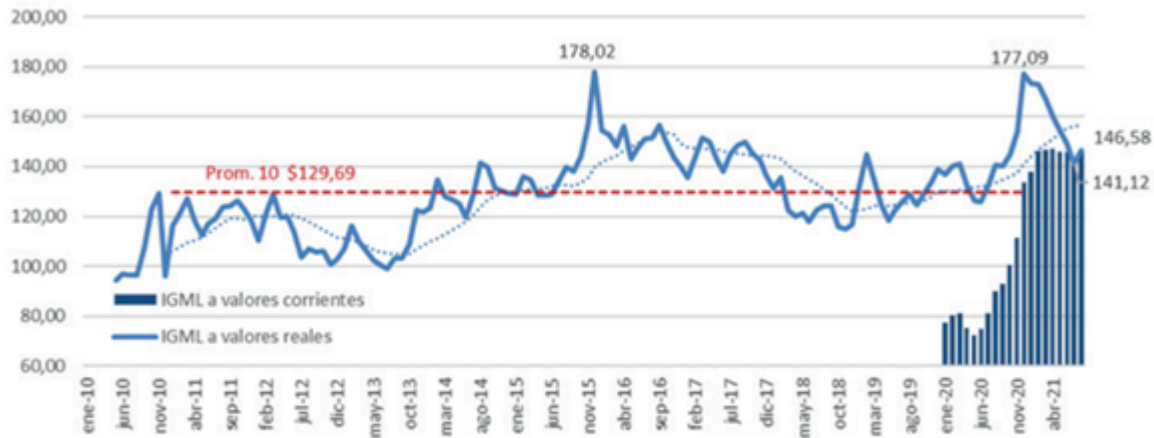
IGML (Índice General Mercado de Liniers), a valores reales (IPIM julio 2021 =1) y pesos corrientes.

Valor de la hacienda vs salarios: ¿Qué condiciona finalmente la suba al mostrador? - 27 de Agosto de 2021