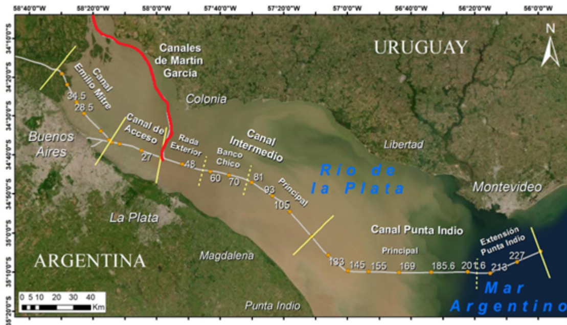
Figura 2.2 Canales del Río de la Plata.

El polo agroindustrial del Gran Rosario tiene capacidad para embarcar 166 M de toneladas de granos por año - 07 de Octubre de 2021