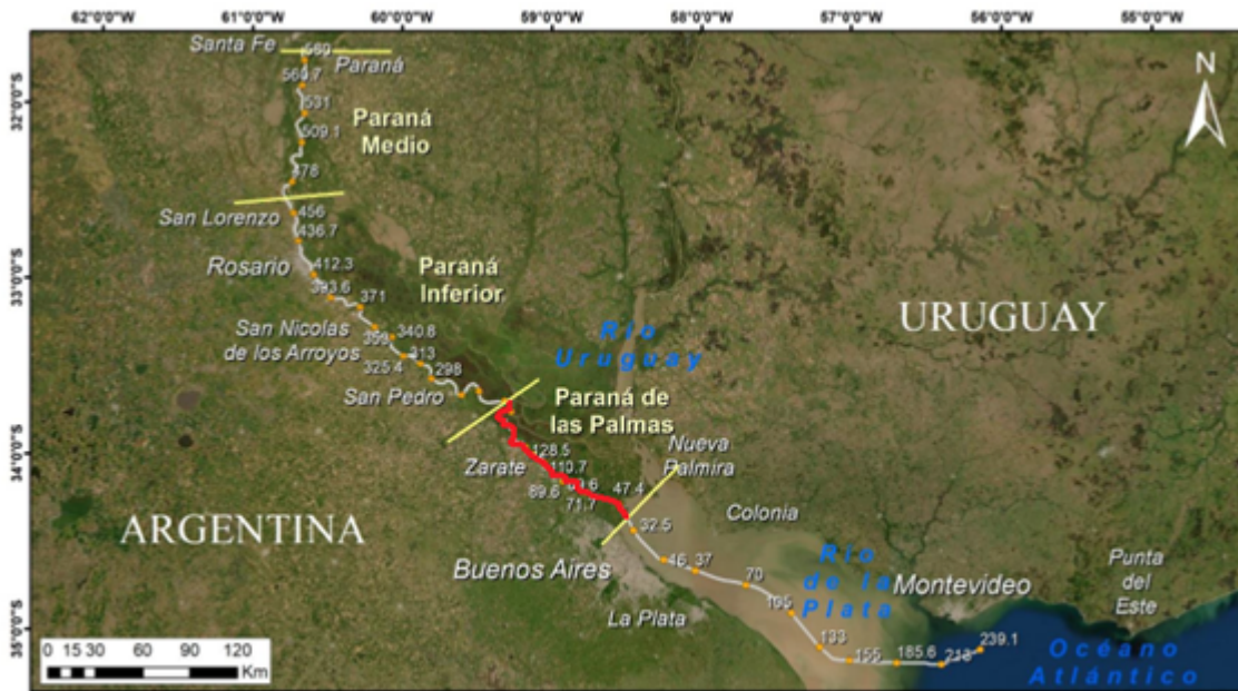
Figura 2.1 Sectores de la VNT.

El polo agroindustrial del Gran Rosario tiene capacidad para embarcar 166 M de toneladas de granos por año - 07 de Octubre de 2021