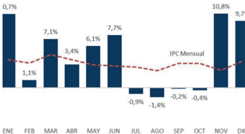
Variaciones mensuales del precio de la carne vacuna (IPCVA) comparado con la tasa de inflación oficial (IPC INDEC).

En este punto, es interesante observar que el aumento promedio que exhibieron los distintos cortes vacunos en el último mes (2,5%), resultan inferiores al 3,8% de inflación esperada por el mercado, según el último Relevamiento de Expectativas de Mercado (REM) publicado por el Banco Central.