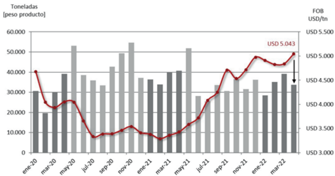
Exportaciones de carne vacuna con destino a China, en base a cifras de INDEC.

COVID cero en China: Un nuevo golpe en plena salida de vacas - 27 de Mayo de 2022