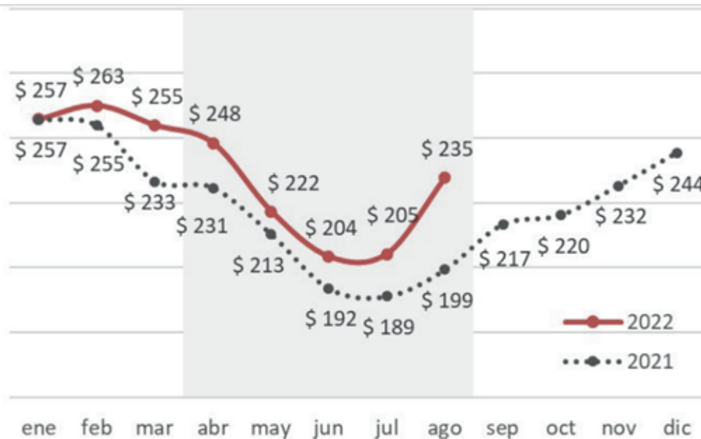
Precio promedio para la categoría vaca (expresados en pesos constantes, base IPIM agosto 2022). Fuente de datos: MAG e INDEC

Si calculamos entonces, el ingreso adicional obtenido por el productor por estas 213 mil vacas adicionales que ha podido remitir este año a faena, arribamos a unos $28,500 millones adicionales, medido en pesos constantes. En dólares unos USD 187 millones de caja adicional en 5 meses.