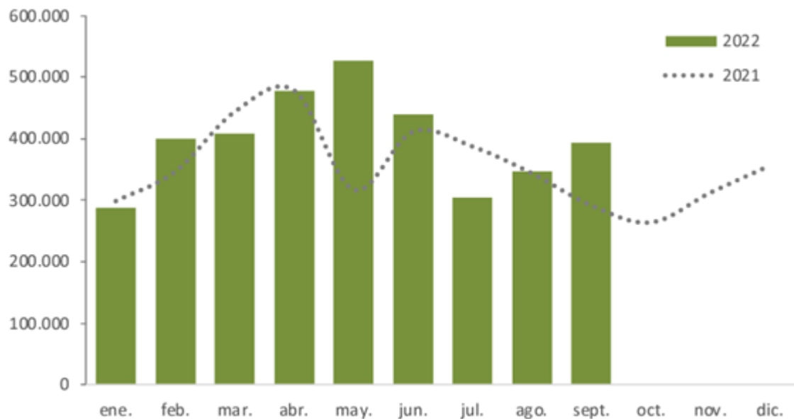
Ingreso total de animales a feedlots, según datos de DTe. informados por SENASA.

Mercado deprimido: Demanda pesada y oferta abundante, un combo difícil de revertir en el corto plazo - 14 de Octubre de 2022