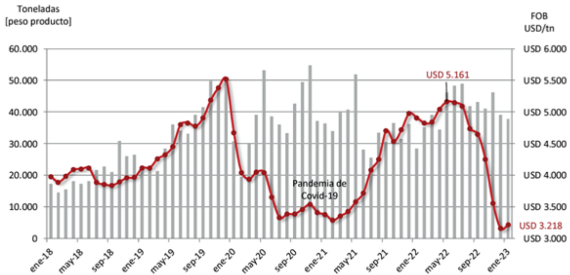
Exportaciones de carne vacuna argentina con destino a China, medidas en volumen y precio, en base a datos del INDEC.

Efecto 'vaca loca': ¿Qué aspectos diferencian el actual escenario respecto del registrando en 2021? - 03 de Marzo de 2023