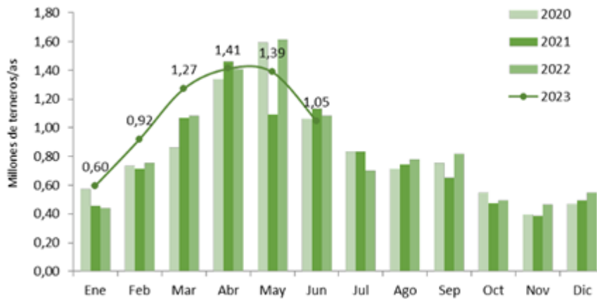
Cantidad de terneros y terneras trasladados desde los campos con destino cría e invernada, en base a datos de SENASA.

Zafra de terneros: Una oferta que comienza a disolverse a media que los campos recuperan receptividad - 07 de Julio de 2023