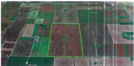
Imagen satelital del inmueble objeto

https://earth.google.com/web/@ GPS 32°38'2.39"S 64° 8'8.89"O; 32°38'22.55"S 64° 8'1.28"O, y, 32°38'38.52"S 64° 8'18.79"O