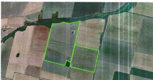
Imagen satelital del inmueble objeto

https://earth.google.com/web/@-32.66929616,-64.03177279,376.8678401a,6352.25016826d,35v,0h,0t,0r/data=OgMKATA https://earth.google.com/web/@-32.66748085,-64.02685026,374.82931922a,6974.00911112d,35v,0h,0t,0r/data=OgMKATA