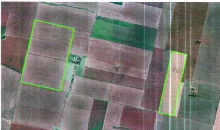
Imagen satelital del inmueble objeto