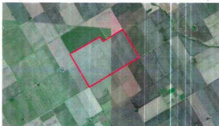
Imagen satelital/informe catastral del inmueble objeto

https://earth.google.com/web/@-33.51888649,-