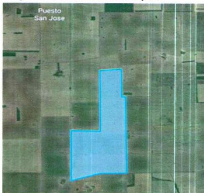
Imagen satelital del inmueble objeto

https://earth.google.com/web/@ GPS:30°31'05.76"S 63°48'34.14"O; 30°28'58,81"S 63°49'09.03"O; y, 30°29'12.48"S 63°48'41.62"O