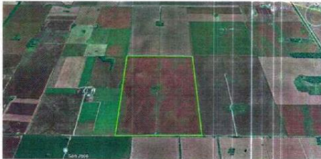
Imagen satelital/informe catastral del inmueble objeto

https://earth.google.com/web/@ GPS 32°38'2.39"S 64° 8'8.89"O; 32°38'22.55"S 64° 8'1.28"O, y, 32°38'38.52"S 64° 8'18.79"O