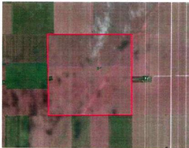
Imagen satelital del inmueble objeto

https://earth.google.com/web/@-33.53526373,-64.47048313,343.90701273a,7106.30017311d,35y,-0h,0t,0r/data=OgMKATA