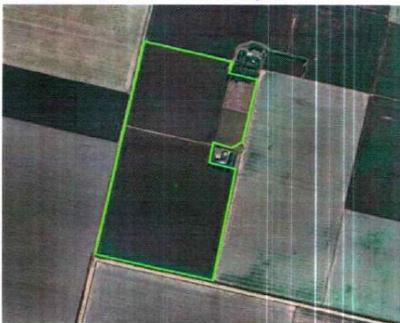
Imagen satelital del inmueble objeto

https://earth.google.com/web/@-32.6811275,-63.98705187,362.15788127a,3020.32451955d,35y,0h,0t,0r/data=OgMKATA