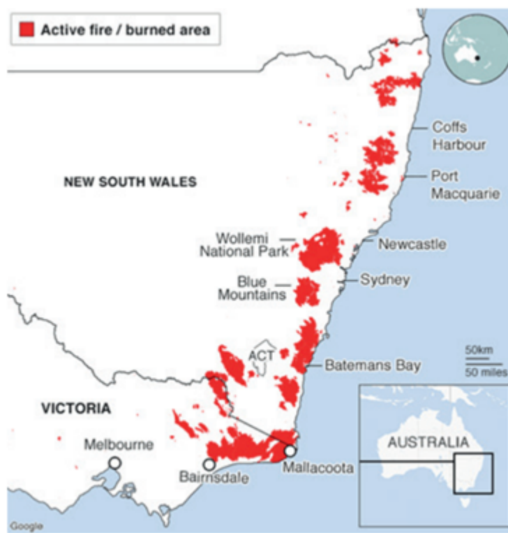
Gráfico 1: Área afectada por focos de incendios activos al 10 de enero.

Incendios en Australia: ¿Qué impactos puede generar en el comercio mundial de carnes? - 17 de Enero de 2020