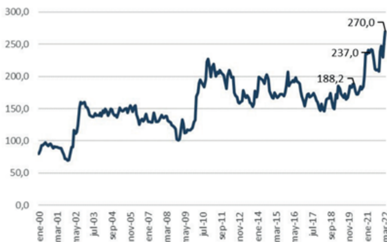
Precio mensual del novillo Liniers (INML), medido en pesos constantes por kilo vivo, corregidos por el IPC, base febrero de 2022

Los valores del novillo, medidos en moneda constante, son los más altos de los últimos 20 años. La oferta de esta categoría sigue siendo escasa y obliga a la industria exportadora a convalidar valores cada vez más altos para cubrir sus requerimientos operativos. La enorme capacidad instalada que hoy presenta la industria, sumado a la firmeza que ejerce la demanda externa seguirán poniendo presión sobre esta acotada oferta local.